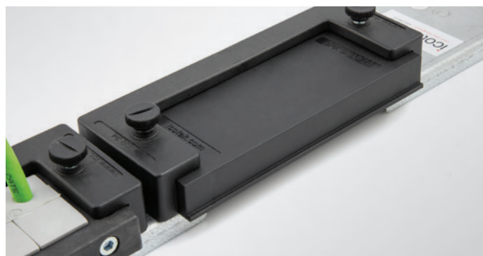
Los espacios no usados se pueden cerrar con las tapas BPK-SNAP.

Preparado para el montaje de KDR-EMV-PFM. Las placas están equipadas con orificios roscados (M5), tapados con tapones. Esto se pueden quitar en caso de ser necesario. Al usar el KDR-EMV-PFM, no es necesario instalar adicionalmente un riel DIN/barra bus sobre la entrada del cable, de lo contrario debe adjuntarse para implementar la conexión EMC